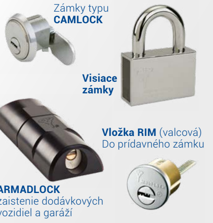
Zámky typu CAMLOCK